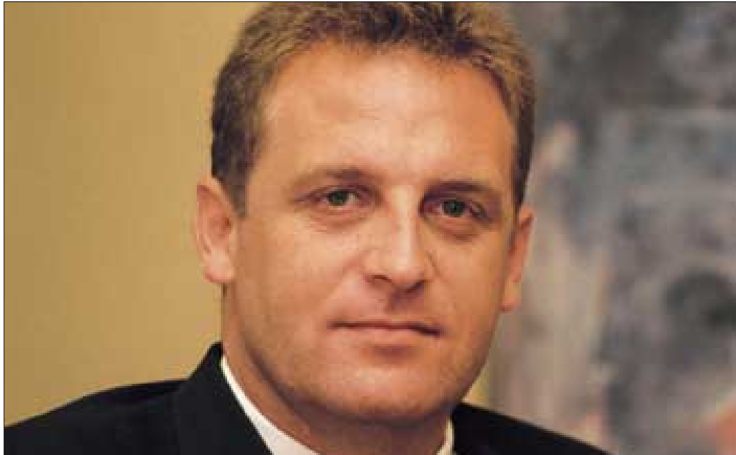
Bartolomé Pérez Gálvez. Director General de Drogodependencias de la Generalitat Valenciana.

La nueva Estrategia Nacional sobre Drogas señala a lo largo de su desarrollo, que para el año 2003 los programas preventivos utilizados en las escuelas españolas habrán debido ser acreditados por las administraciones públicas. El Programa ¡ORDAGO! El desafío de vivir sin drogas ha superado con éxito este proceso recién inaugurado.