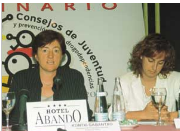
La Secretaria de Drogodependencias del Gobierno Vasco y la Presidenta del CJE/EGK.

Responsables del Área de salud y calidad de vida del Consejo de la Juventud de España y de los Consejos de la Juventud de una decena de Comunidades Autónomas se reunieron en Bilbao, coincidiendo con el Día Internacional contra el Uso Indebido y el Tráfico Ilícito de Drogas. Invitados por EDEX, buscaron respuestas a tres cuestiones: ¿cuáles son las políticas y estrategias exitosas en materia de prevención?, ¿qué estamos haciendo al respecto desde nuestras organizaciones? y ¿qué podemos hacer juntos?